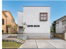
夕焼けテラスの家