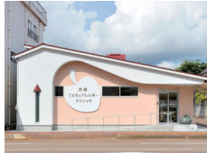
太田子どもとアレルギークリニック