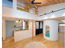
まんまるヌックと展望デッキ