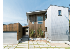
アーキテクトラボ