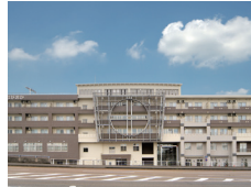
健康の駅ながおか