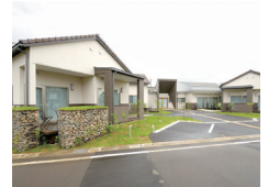
サポートセンター摂田屋